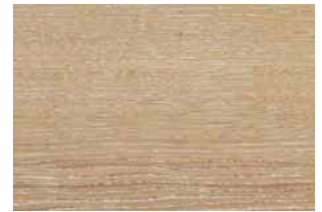
Rovere sbiancato cera Whitened oak, wax Eiche geweißt, gewachst