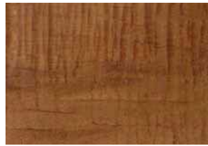
Kauri "piallato", olio Kauri "hand sanded", oil Kauri "gehobelt", geölt