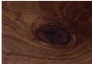
Noce con nodi, olio Walnut with knots, oil Nussbaum mit Knoten geölt