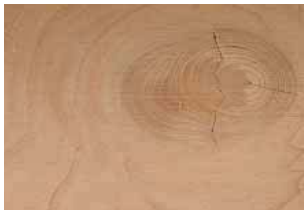
Cedro grezzo Cedarwood, raw Zedernholz unbehandelt