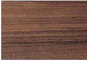
Noce olio Walnut, oil Nussbaum geölt