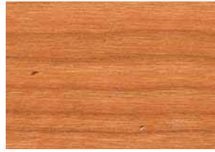
Ciliegio olio Cherrywood, oil Kirschbaum geölt