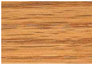
Rovere olio Oak, oil Eiche geölt