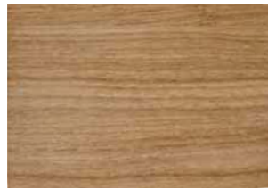
Rovere cera Oak, wax Eiche gewachst