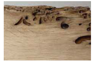
Rovere "Briccole" grezzo "Briccola" Oak, raw "Briccola" Eiche, unbehandelt