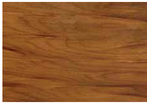
Kauri "levigato", olio Kauri "machine sanded", oil Kauri "geschliffen", geölt