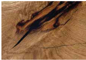
Rovere con nodi olio Oak with knots, oil Eiche mit Knoten geölt